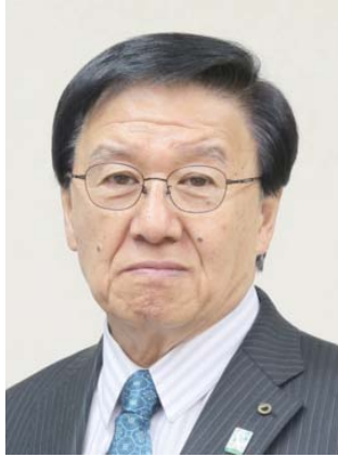
江別市長 三好 昇

札幌交響楽団ニューイヤースペシャルコンサートin北広島が1月7日火19時〜21時、北広島市芸術文化ホール中央6丁目1-1 / 花ホールJR北広島駅東口4番出口1分徒歩、料金は全席指定一般3,500円、高校生以下1,800円。曲はベートーヴェン交響曲第6番「田園」ほか。問・同ホール011-372-17667。